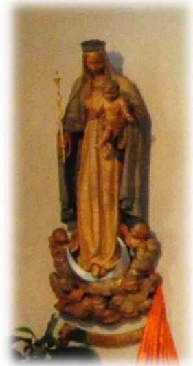
Foto: Marienstatue in Christkönig Linden

Nimm uns hinein in deine große Gottesliebe. Amen.