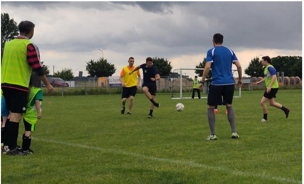
Auf und neben dem Platz war es ein farbenfroher Nachmittag

Die vier katholischen Pfarreien im Pastoralraum Gießen-Süd werden im Jahr 2027 zusammen eine neue gemeinsame Pfarrei gründen. Auf dem Weg dorthin sind unter anderem noch die Fragen nach der neuen Gottesdienstordnung oder den zukünftigen Gebäuden zu klären. Schon jetzt intensiviert sich bereits die Vernetzung: sowohl in der Gremienarbeit als auch bei gemeinsamen Veranstaltungen.