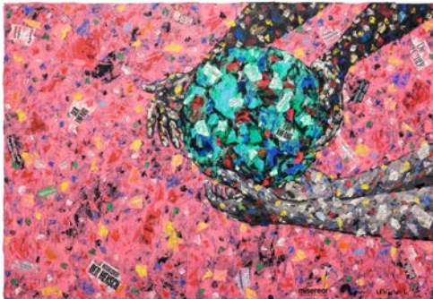
Das Misereor-Hungertuch 2023 „Was ist uns heilig?“ von Emeke Udemba