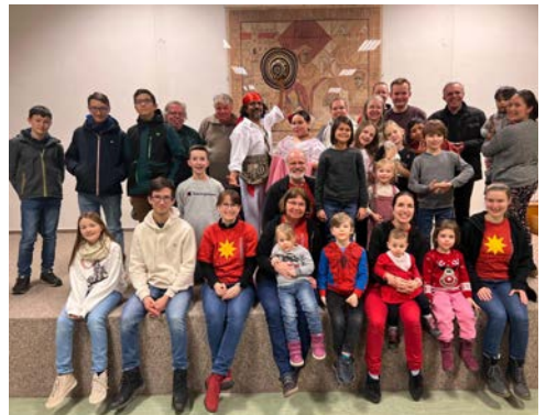
Sternsinger und Unterstützer bei der Abschlussfeier im Pfarrsaal St. Thomas Morus

Wir danken deshalb allen Beteiligten und Spendern für die diesjährige erfolgreiche Aktion, bei der 11.095 € gesammelt werden konnten!