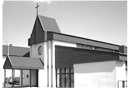
Hl. Maria Königin des Friedens Jakob-Friedrich-Nold-Straße 8 64589 Stockstadt