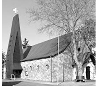
St. Bonifatius Friedrichstraße 6 64560 Riedstadt-Goddelau