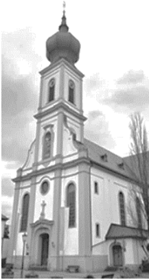
St. Maria Magdalena Magdalenenstraße 54 64579 Gernsheim