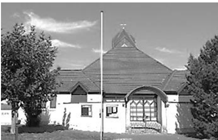
St. Alban Kammerhofweg 7 64560 Riedstadt