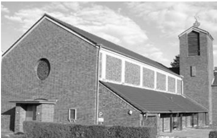
St. Maria Goretti Jahnstraße 19 64584 Biebesheim