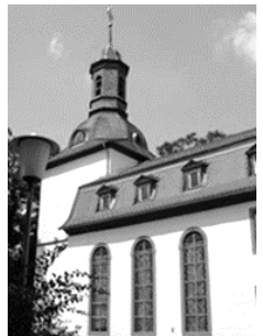
Hospitalkirche Philippshospital 101 64560 Riedstadt