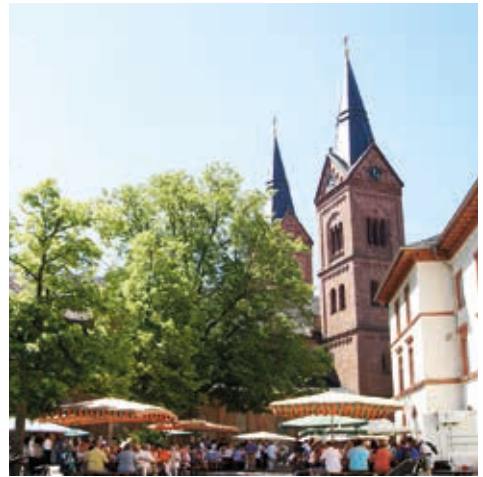
Wallfahrtsfest 2019 von Angela Ewers

Es ist zum Beispiel der einzige Weg zur Kirche für die Anfahrt behinderter Gottesdienstbesucher oder auch für die Beerdigungsinstitute und den anschließenden Weg zum Friedhof.