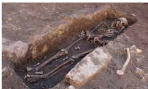
Bestattung einer Frau, Seitenansicht SPAU GmbH, Anke S. Weber

Geplante Umbaumaßnahmen der Pfarrgemeinde St. Marcellinus und Petrus Seligenstadt zur Errichtung eines barrierefreien Zugangs zur Basilika machten es notwendig, den aus Sandsteinplatten bestehenden Vorplatz des Portals in zwei Bereichen zu öffnen. Durch den Neubau des Südturms im Jahre 1873 sowie die Gestaltung des heutigen Treppenaufgangs in den 1990er Jahren ging man von einer weitgehenden baulichen Störung des Untergrunds im unmittelbaren Umfeld der Kirche aus. Umso erstaunlicher, dass beim Entfernen der Sandsteinplatten auf dem Vorplatz der Basilika - nur wenige Zentimeter unter dem Schotter - Skeletteile und eine Steinsetzung entdeckt und durch das ausführende Bauunternehmen Richard Sprey GmbH der Unteren Denkmalschutzbehörde des Landkreises Offenbach gemeldet wurden. Nach Rücksprache mit dem Landesamt für Denkmalpflege dem mit der Planung beauftragten Unternehmen Post Architekten PartGmbH sowie einem anberaumten Ortstermin mit allen Beteiligten wurde entschieden, dass der Bereich einer eingehenderen archäologischen Untersuchung bedarf.