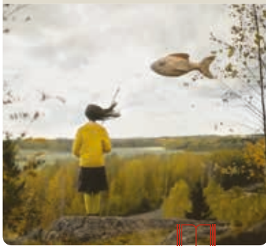
Illustration von Peter G. Schmitt