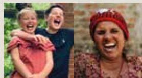
... der Hirte ...

Katholisches Bibelwerk e. V. • Deckerstraße 39 • 70372 Stuttgart • Tel: 0711/6192050 bibelinfo@bibelwerk.de • www.bibelwerk.de/verein