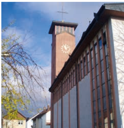
Pfarrbrief der Gemeinde St. Marcellinus und Petrus