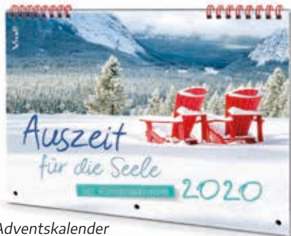
Adventskalender „Auszeit für die Seele 2020“: 62 Seiten, 27 x 40 cm (aufgeklappt), durchgehend farbig, Spiralbindung, zum Aufhängen, Bestellnummer: 135030, 5,95 Euro

Tag für Tag regt der Vivat!-Adventskalender „Auszeit für die Seele 2020“ dazu an, innezuhalten, sich überraschen zu lassen und sich an die Botschaft des Advents zu erinnern. Warten, Aufbruch, Achtsamkeit und Erfüllung: Das sind die Kernbotschaften der vier Adventssonntage, die vom 1. Advent bis zum 26. Dezember durch Impulse, Geschichten und Bilder stimmungsvoll in Szene gesetzt werden. Dabei bietet der Kalender zahlreiche Anregungen für kleine Rituale, die dazu ermutigen, aus dem Vorweihnachtstrubel auszubrechen und für einen Moment abzuschalten, und ist so eine wertvolle tägliche Erinnerung daran, worum es im Advent wirklich geht: sich auf den Weg begeben zum Licht, das uns Gott mit der Geburt Christi geschenkt hat.