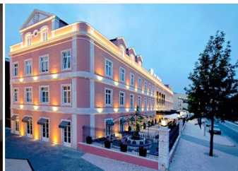
SANA Silver Coast **** Caldas da Rainha – 11.06. - 12.06.2025

Dieses Hotel im Stadtzentrum von Lissabon erwartet Sie 300 m vom U-Bahnhof Campo Pequeno und 5 km vom Flughafen Lissabon entfernt.