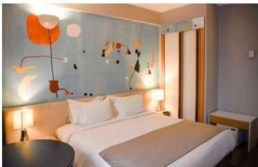
Hotel 3K Barcelona **** Lissabon 09.06. – 11.06.2025

Dieses Hotel im Stadtzentrum von Lissabon erwartet Sie 300 m vom U-Bahnhof Campo Pequeno und 5 km vom Flughafen Lissabon entfernt.