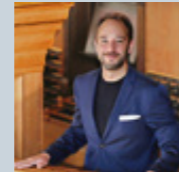
Gerhard Löffler Orgel