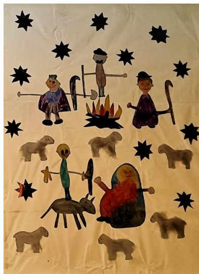
Adventsfenster Kindergarten 2020