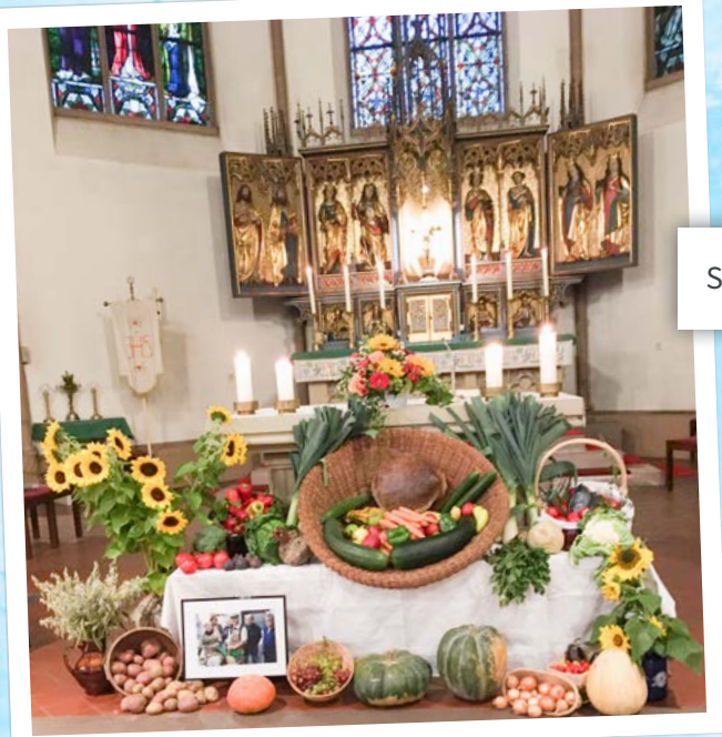
St. Michael Hambach