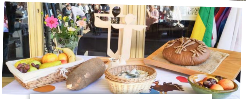
Ökumenischer Freiluft-Gottesdienst im Kastanienhof „Danke für das bunte Leben“ zum Abschluss der Interkulturellen Woche