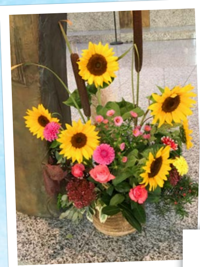
Erscheinung des Herrn