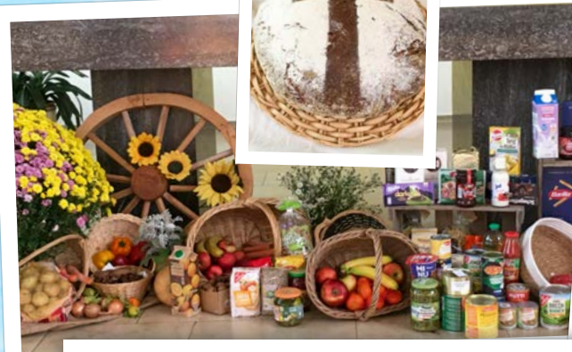
In St. Wendelinus Wald-Erlenbach zum Thema „Lebendiges Wasser“ mit Taufe eines Kommunionkinds.