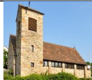
St. Michael Buchklingen