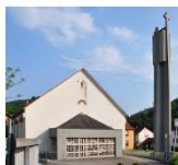
St. Wendelin UnterFlockenbach