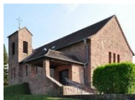
Unbefl. Herz Mariens Löhrbach