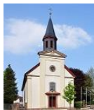
St. Bonifatius Ober-Abtsteinach

11. Oktober 2024 bis 10. November 2024 Nr. 6/2024