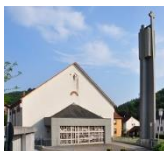
St. Wendelin Unterflockenbach