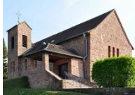
Unbefl. Herz Mariens Löhrbach