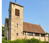
St. Michael Buchklingen