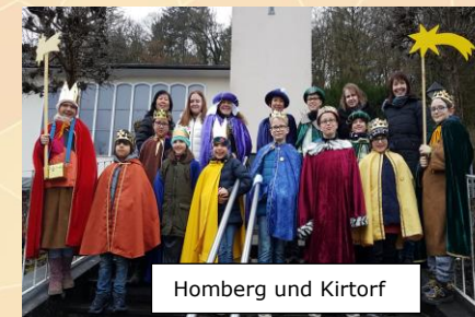
Homberg und Kirtorf