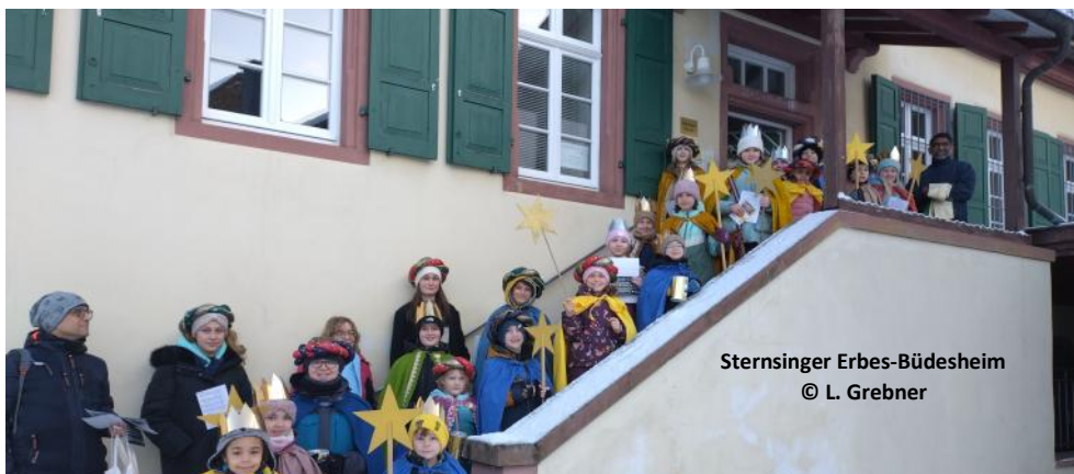
Sternsinger Erbes-Büdesheim