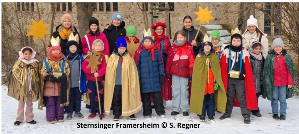
Sternsinger Framersheim