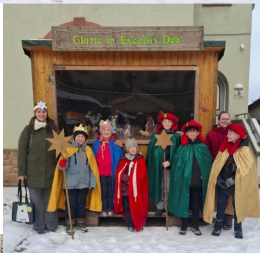
Sternsinger Ober-Flörsheim, oben © Fam. Käufer Petry, rechts H. Kuenen