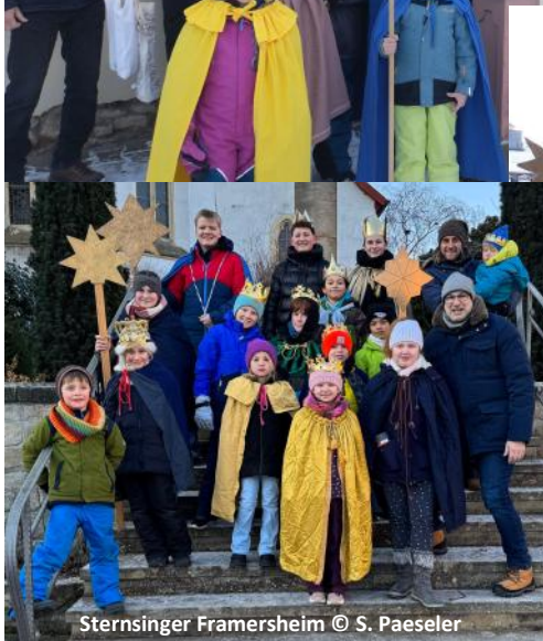
Sternsinger Framersheim