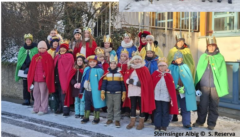
Sternsinger Albig