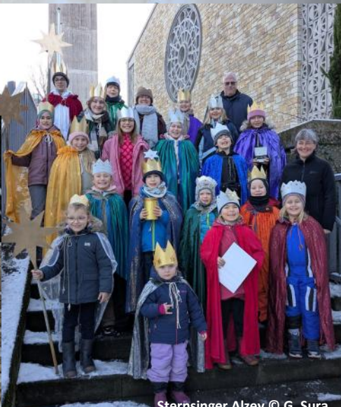
Sternsinger Alzey