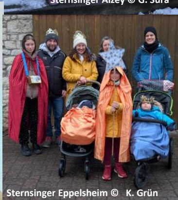
Sternsinger Eppelsheim