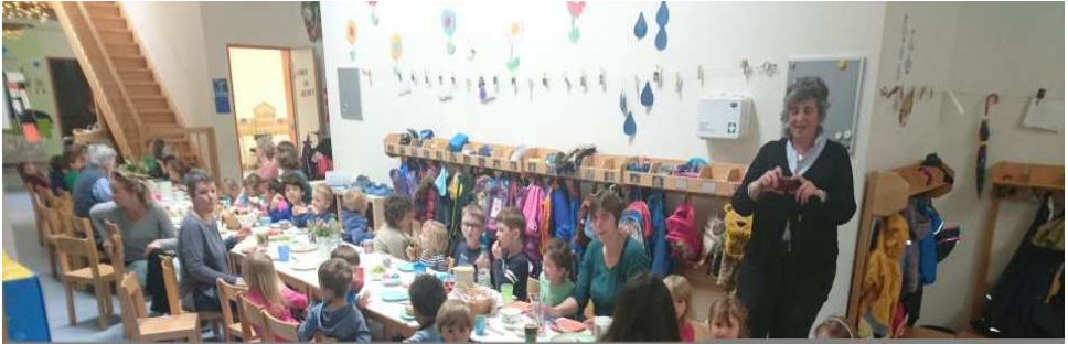
Osterfrühstück in unserem Kindergarten

Auch in unserem Kindergarten fand Ostern statt: Gemeinsames Osterfrühstück mit Pfarrer und Diakon, allen Kindern und ErzieherInnen.