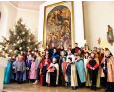
Dittelheim, Heßloch, Frettenheim Dorn-Dürkheim, Hillesheim