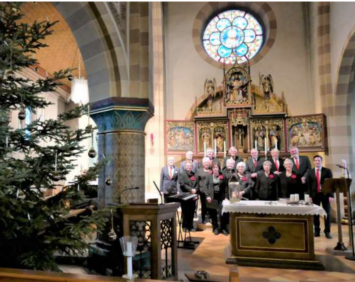
Adventsgottesdienste mit den Kirchenchören, die die Messe mit ihrem Gesang mitgestalteten. 3. Advent Westhofen (oben) und 4. Advent Heßloch (unten). Mitgestaltet vom Kirchenchor.