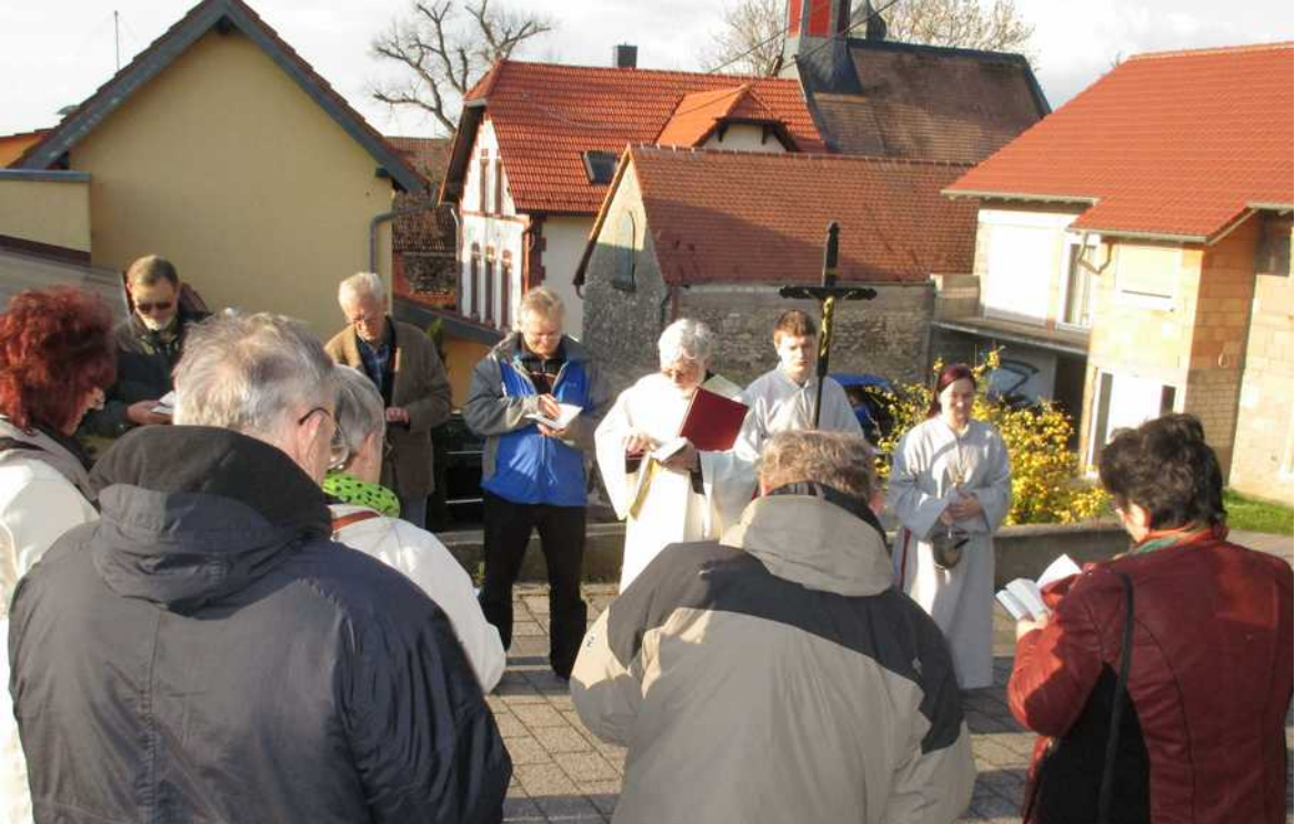
Bittprozession in Frettenheim (oben) und Kräutersträuße Heßloch (unten)