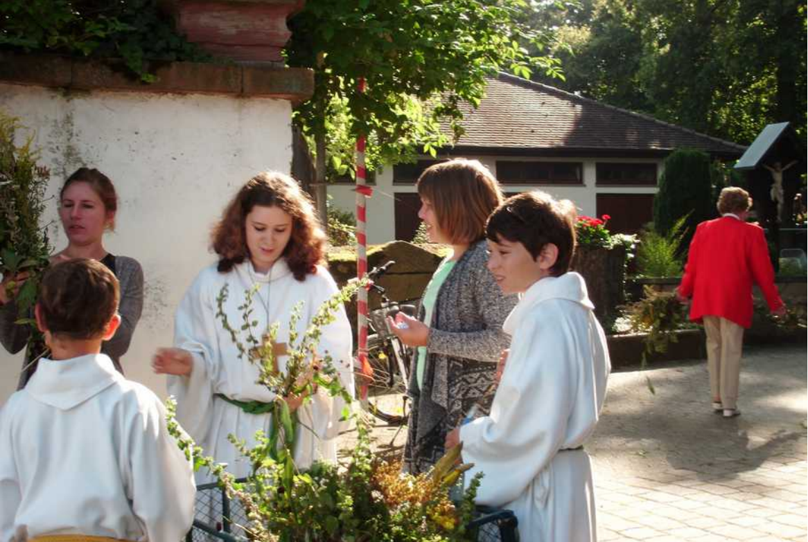
Kräutersträuße in Heßloch oben und Pfarrfest in Westhofen unten.