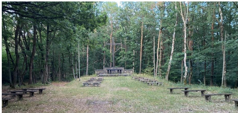
Belle Kreuz im Binger Wald in der Gemarkung Weiler

Das Bündnis der Gemeinden Churches for Future Bingen organisiert nun zusammen mit dem Forstamt Boppard im Weilerer und Binger Wald eine kostenfreie Waldbegehung für alle, die sich über den tatsächlichen Zustand unseres Waldes in Zeiten der Klimakrise informieren möchten.