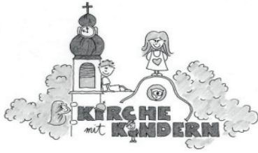
St. Gereon Nackenheim