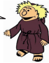
St. Alban Bodenheim