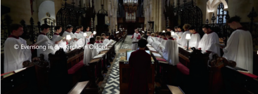
© Evensong in der Kirche in Oxford

In der Tradition der anglikanischen Kirche kennt man den „Evensong“, das Abendgebet in den dortigen Kirchen. Auch im Bistum Mainz werden in verschiedenen Kirchen inzwischen diese besonderen liturgischen Feiern angeboten.