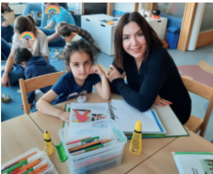
Das Kindergarten- Team

mehr. Allen Eltern und Kindern bereiteten die verschiedenen Angebote viel Freude.