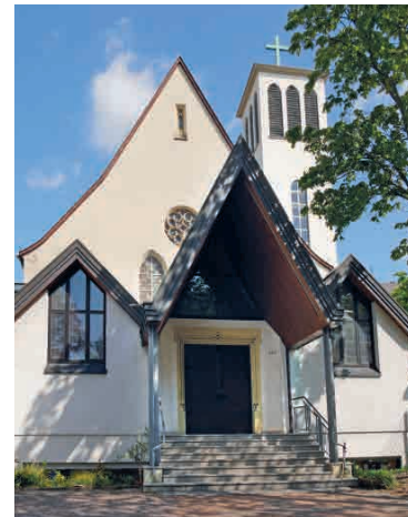
Heimat der Eberstädter und Nieder-Beerbacher Katholiken: die Pfarrkirchen St. Georg (links) und St. Josef