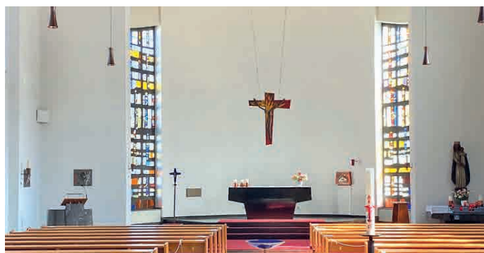
Hell und einladend: Der Innenraum von St. Georg