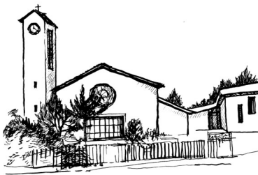
St. Michael Nieder-Ramstadt