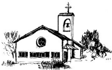
St. Pankratius Modau