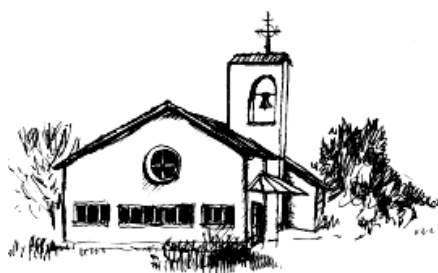
St. Pankratius Modau

Asche auf dein Haupt – so sagen wir scherzhaft, wenn jemand etwas ange stellt hat. Oft ist das aber gar nicht als Scherz gemeint. Wie schnell werden heute Nachrichten hin und her geschickt. Das erleichtert vieles, aber es setzt auch unter Druck: Viele Nachrichten in kurzer Zeit, die dennoch zügig und schnell beantwortet werden wollen. Wie schnell kommt es da zu Missverständnissen. Es gibt zahlreiche Smileys auf dem Handy, aber bis jetzt noch keines, mit dem man anzeigt, dass man nicht einfach nur verärgert, sondern wirklich verletzt ist. Gewissermaßen ein Smiley „Asche auf dein Haupt!“.