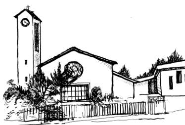
St. Michael Nieder-Ramstadt