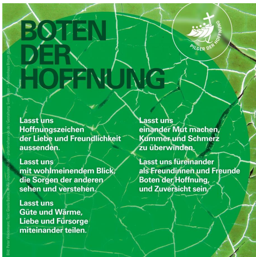
Text: Gisela Baltes, www.impulstexte.de, Layout: Sven Jäger – Medienhaus Bistum Würzburg, In: Pfarrbriefservice.de

Eine gesegnete Fastenzeit wünscht Ihnen Stephan Weißbäcker, Pfarrvikar