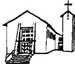
St. Peter und Alexander Dorndiel