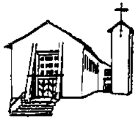
St. Peter und Alexander Dorndiel