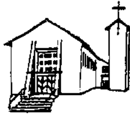
St. Peter und Alexander Dorndiel