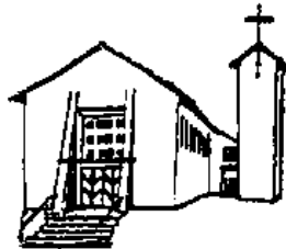
St. Peter und Alexander Dorndiel