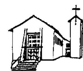
St. Peter und Alexander Dorndiel