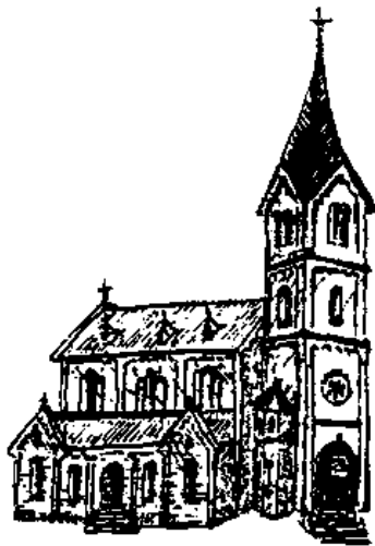
St. Gallus - Groß-Umstadt