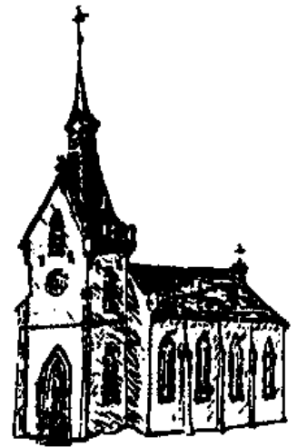
St. Bartholomäus - Heubach