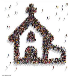
Erstkommunion 2025 in der Mainspitze

Wir sind lebendige Steine in deinem Haus