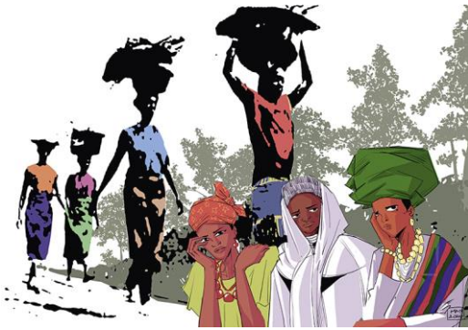
© 2024 World Day of Prayer International Committee, Inc. (weboptimiert)