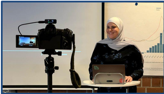
Eine Teilnehmerin der Kompetenz-Workshop hält ihre Abschlusspräsentation

Das Projekt bietet persönliche Bildungsbegleitung zum Deutschkurs, Kompetenz-Workshops, Beratung, Sprach-Cafés und