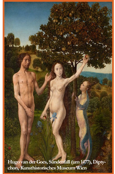
Hugo van der Goes, Sündenfall (um 1477), Diptychon, Kunsthistorisches Museum Wien

Schlangen haben die Menschen seit jeher fasziniert. Als Symbol des Bösen, aber auch als Lebenssymbol sind sie uns vertraut. Bei Mose ist die Schlange Zeichen der Heilung, im Neuen Testament heißt es: Die alte Schlange, die der Teufel und der Satan ist. Vom Buch Genesis ausgehend können Fragen von Schöpfung und Sündenfall, aber auch das Wirken des Bösen in unserer modernen Welt Themen der Gespräche sein.