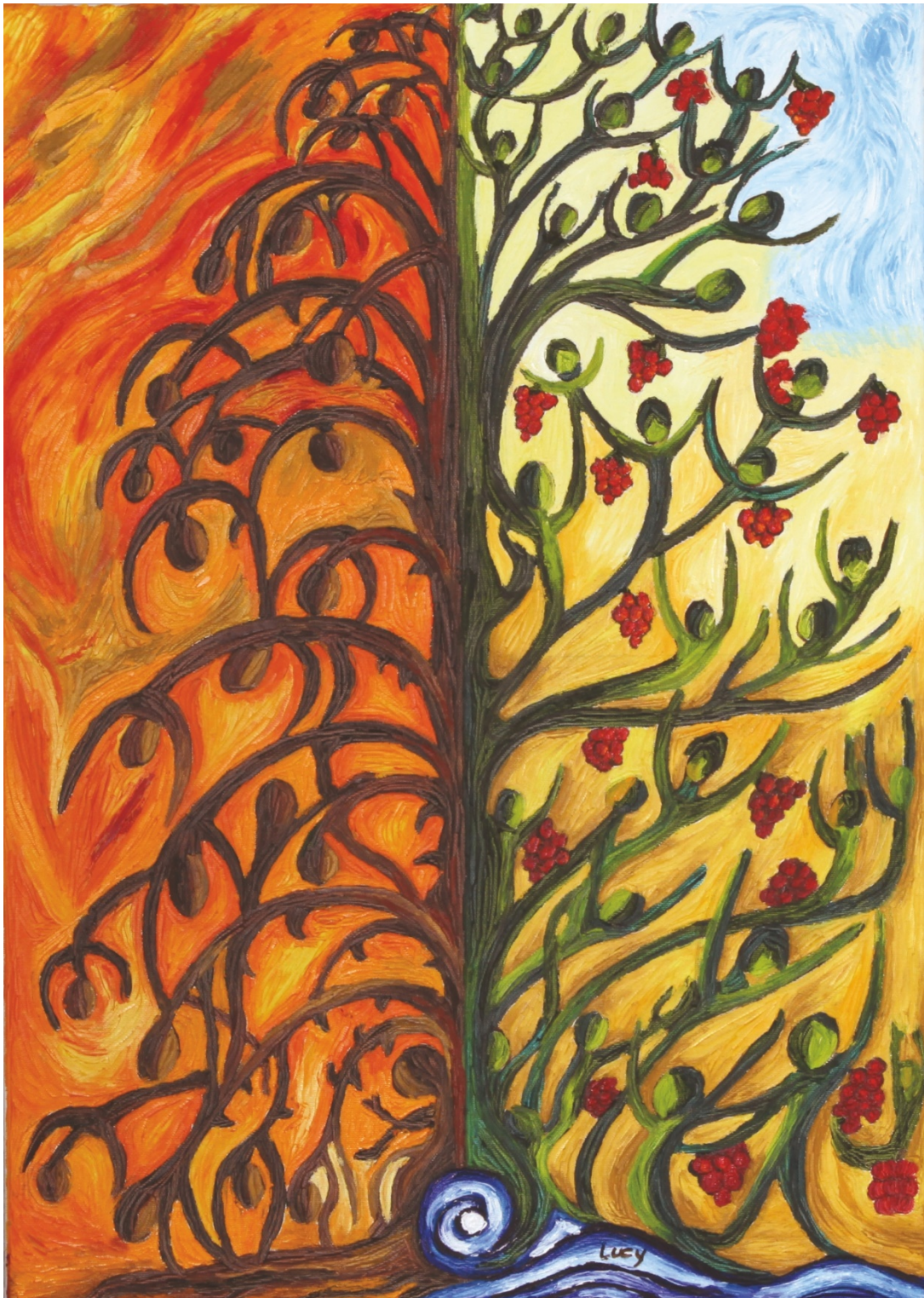
Baum des Fluches und des Segens, Lucy D´Souza-Krone