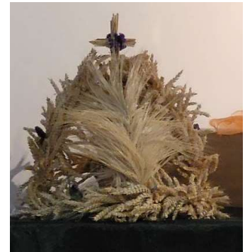
Erntekrone 2023

Liebe ehrenamtlich Engagierte, früher wurde nach Beendigung des Kornschnittes am Erntedankfest ein Kranz oder eine Krone aus Getreide von den Feldarbeiterinnen und Feldarbeitern mit der letzten Erntefuhre an den Gutsherrn überbracht. Die Erntekrone galt als ein Symbol der Dankbarkeit gegenüber dem Schöpfer und als Dankeschön für die gelungene Zusammenarbeit aller Frauen und Männer, die ernten durften, was sie gesät haben, was durch ihren Einsatz und mit Gottes Hilfe gereift ist.