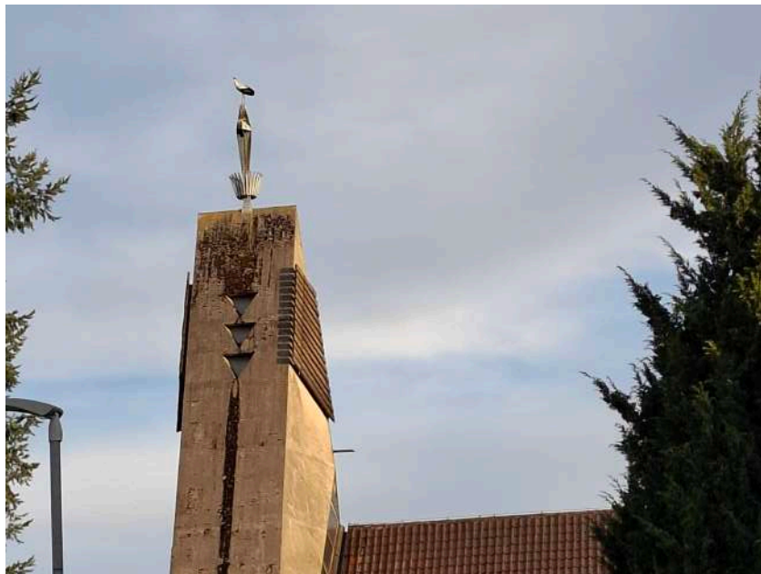
Storch auf der Schlitzer Kirchturm-Spitze