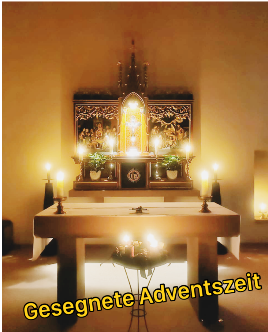
St. Antonius v. Padua, Eichenrod

Eichenrod, Freiensteinau, Grebenhain, Herbstein, Ulrichstein (inkl. Gottesdienste von Landenhausen, Lauterbach, Schlitz)