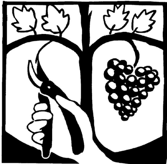
Evangelium: Johannes 15,1-8