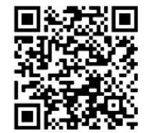
QR-Code zur Gottesdienstanmeldung