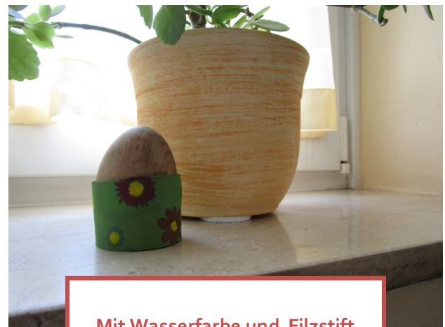
Mit Wasserfarbe und Filzstift