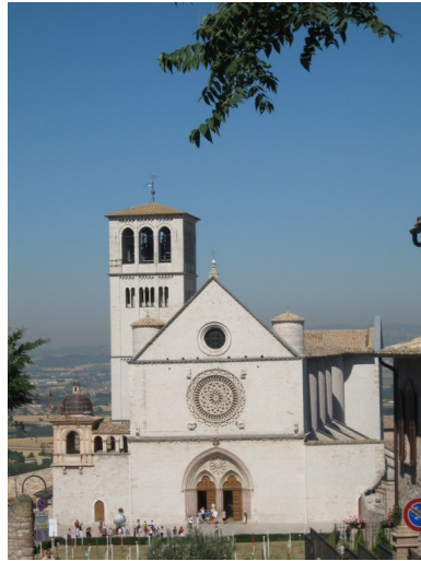
S. Francesco in Assisi