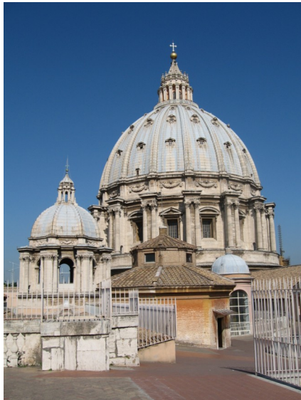
St. Peter in Rom