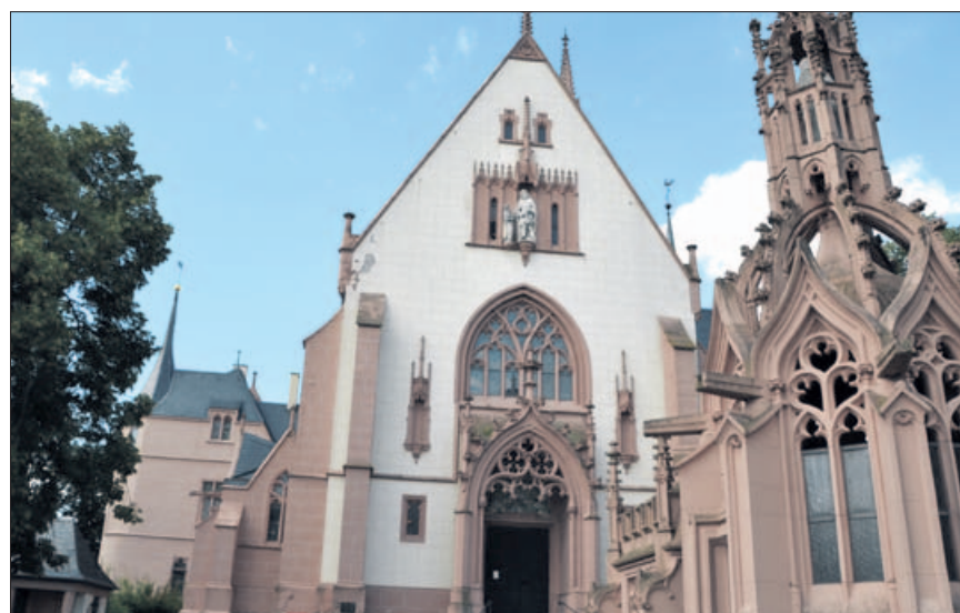
Goethe war auch hier und besah sich die Prozession und das Picknick der Pilger.