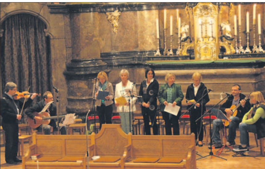
Die Musikgruppe Hallel hat sich dem neuen geistlichen Lied verschrieben.

Zu den weiteren Chören, die Alexander Müller außer „clara voce“ leitet (siehe Seite 3), gehört der Gospelchor „Amen Singers“. Er ist der größte Chor der Pfarrei mit etwa 50 Mitgliedern zwischen 16 und 60 Jahren. Sie tragen ihre Stücke stets auswendig vor. Das „Binger Vokalensemble“ mit rund 15 Sängerinnen und Sängern wird ebenfalls von Müller geleitet. Es hat sich auf unbekannte Werke verschiedener Epochen spezialisiert. Einmal im Monat hält der Chor eine öffentliche Probe vor der Sonntagsmesse ab, zu der alle Interessierten eingeladen sind. Im anschließenden Gottesdienst wird das soeben Geprobte zur Aufführung gebracht. (edf)