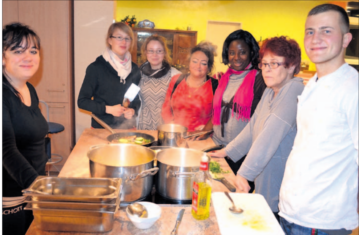
Beim internationalen Kochkurs der Flüchtlingshilfe rühren Vertreter der Katholischen Hochschulgemeinde, des Caritaszentrums und des Internationalen Freundeskreises gemeinsam in den Töpfen der Stift-Küche.