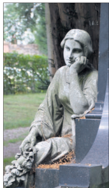
Ein Blick aus der Ewigkeit: am Alten Friedhof.