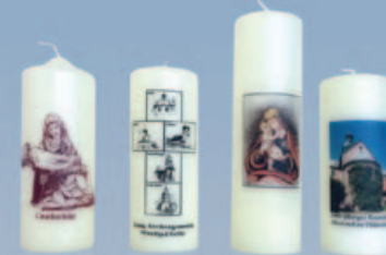
Foto- und Stichkerzen werden nach ihren Wünschen und Vorstellungen angefertigt.