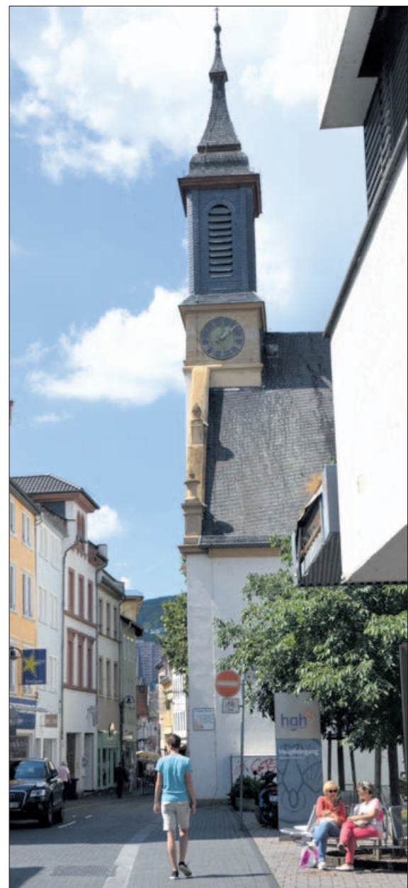
Straßenszene mit Kapuzinerkirche: Die Kirche ist heute Teil des Heilig-Geist-Hospitals.