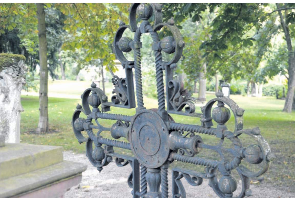
Eine Stadt mit viel Grün. Nicht nur am „Kulturufer“, dem ehemaligen Gartenschaugelände, sondern auch in der Stadt finden sich ruhige Plätze.