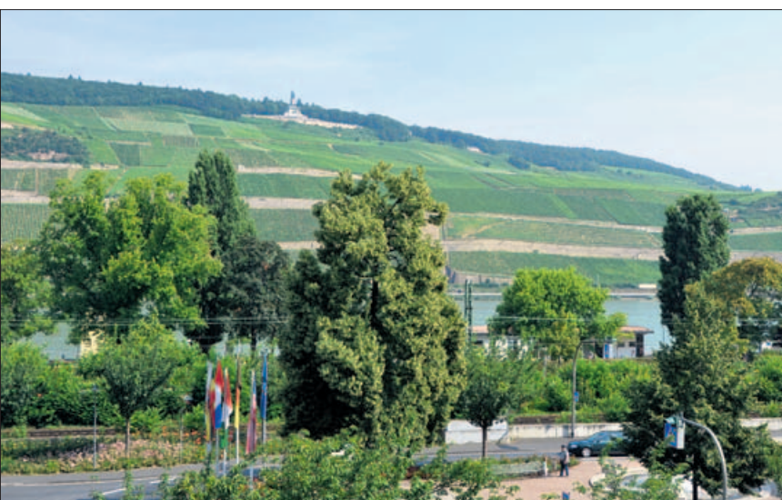
Wie im Kurhotel: Von allen Speisesälen haben die Bewohner und Besucher des Stifts den Panoramablick auf Rhein und Reben.