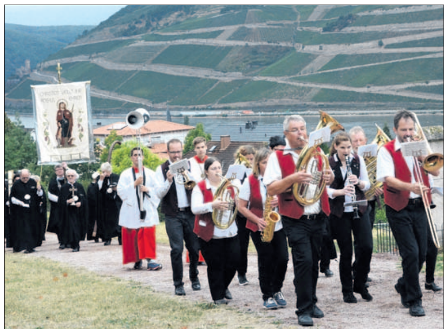
Die Rochuswallfahrt zieht viele Menschen an.