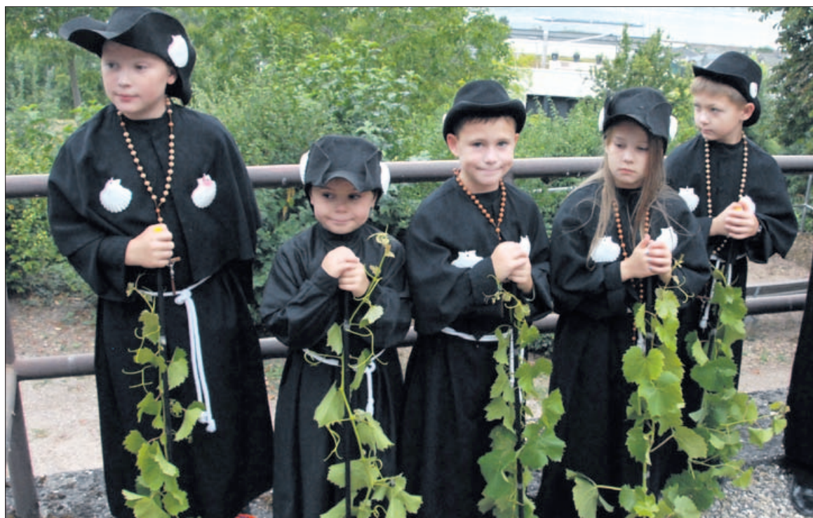
Als sogenannte „Rochusjer“ begleiten Grundschulkinder Pilger und die Prozession.