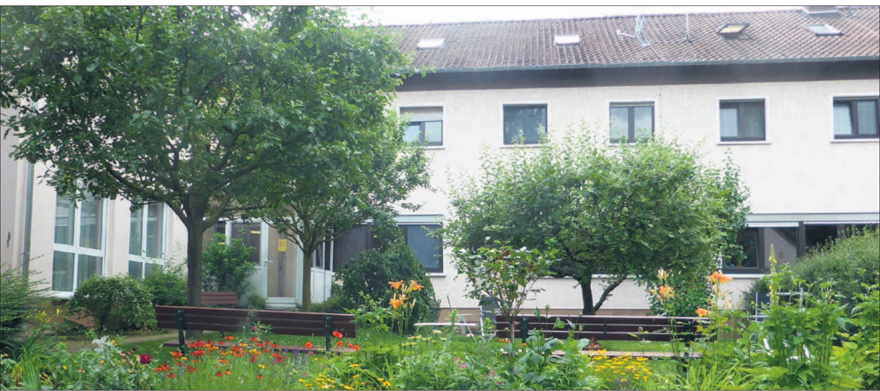
Im Grünen. Bei den Kursen im Kardinal-Volk-Haus können die Teilnehmer den schönen Garten genießen.