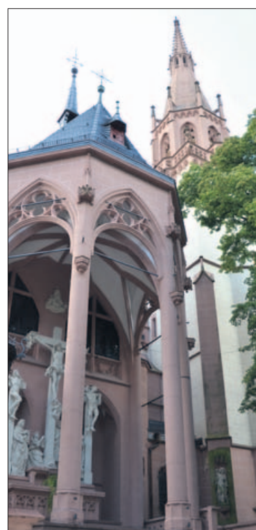
Das Ziel der Pilger: die Rochuskapelle

Gemeinsam organisieren die Rochusgeschwister auch die „Rochi-Kerb“ an Pfingsten, bauen an jedem Adventssonntag ein neues Krippenbild mit fast lebensgroßen Figuren auf, die Bruderschaftsmitglied Franz Kellermeier einst selbst schnitzte. Eine geschnitzte Figur, die allerdings den heiligen Rochus zeigt, steht auch an prominenter Stelle in Lotz' Wohnzimmer. Für das Ehepaar Lotz ist Rochus mehr als ein Pestheiliger. Er ist für sie Symbol der Gemeinschaft ihres Glaubens, die in der Wallfahrt deutlich wird.