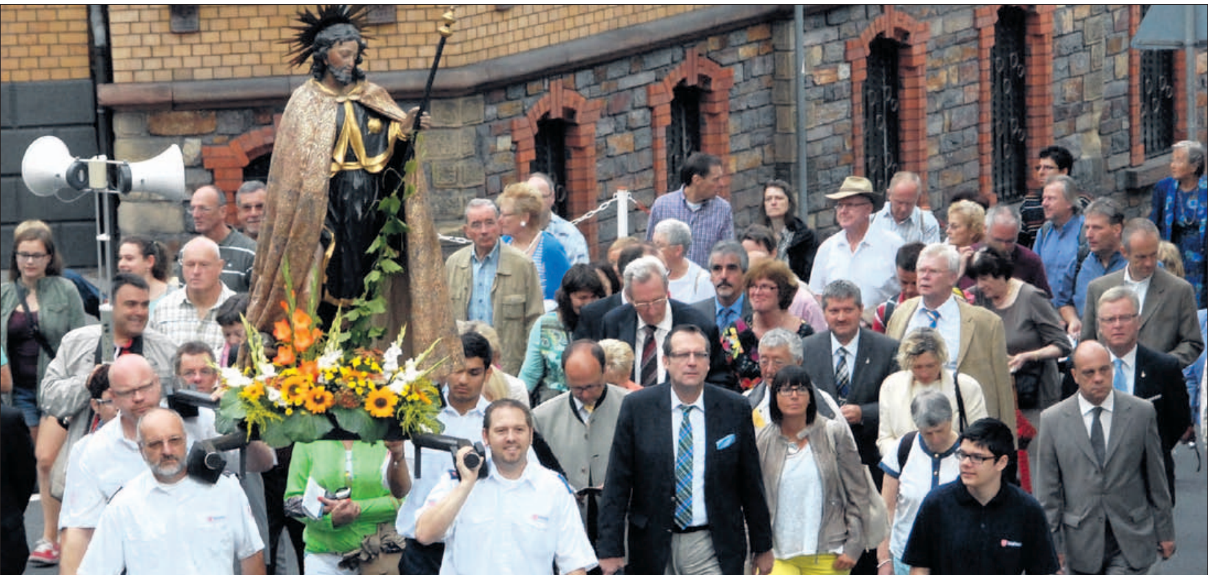
Für den Glauben auf die Straße: Im August ist Rochusfest in Bingen am Rhein.