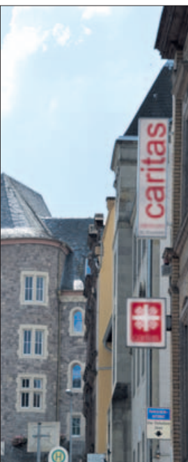
Das Hilfe Caritaszentrum an der Rochusstraße

Auch zum Gebet kommen die Christen der beiden Gemeinden häufig zusammen. So sind gemeinsame Gottesdienste zum Weltgebetstag und am Pfingstmontag feste Termine, und auch beim Rochusfest wird jeweils ein ökumenischer Gottesdienst gefeiert: Diesmal am Donnerstag, 25. August, um 19.30 Uhr in der Rochuskapelle. (edf)