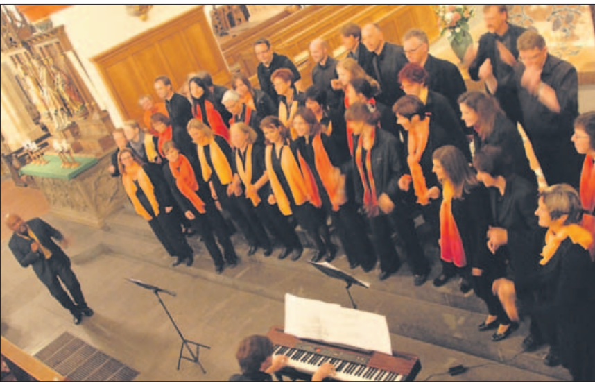
Der Gospelchor „Amen Singers“ in Aktion