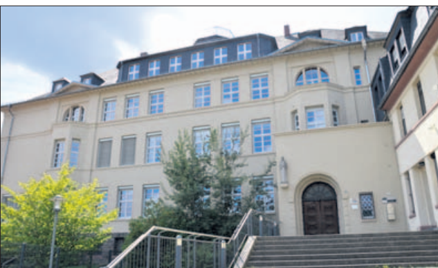
Die private Hildegardisschule in Trägerschaft des Bistums Mainz ist „die Mädchenschule der Region“.

Bingen in Bildern – ein Fotospaziergang von Ruth Lehnen