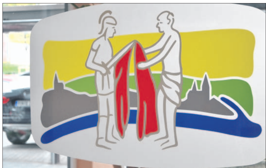
St. Martin auf Augenhöhe: So verstehen die Mitarbeiterinnen und Mitarbeiter des Stifts ihren Dienst.