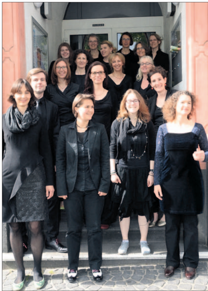
„Helle Stimme“ – auf hohem Niveau singt der Frauenchor „clara voce“.