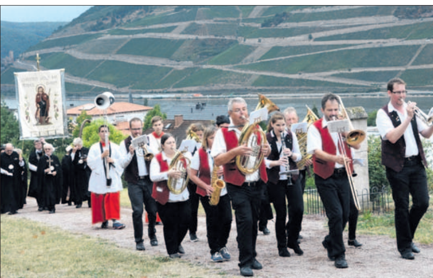
Mit der Fahne des Pestheiligen hoch über dem Rhein, ein Bild von 2015