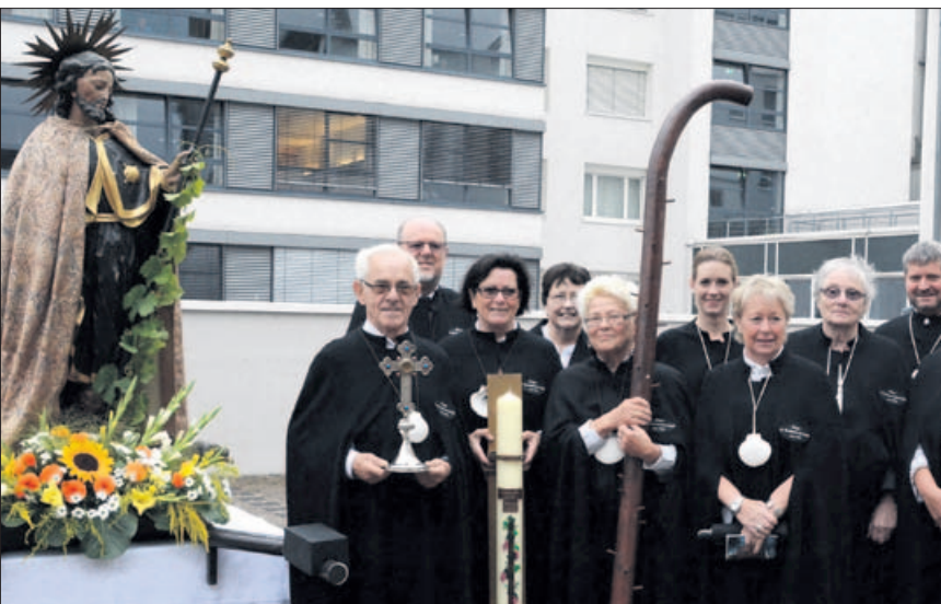
Bei der Wallfahrt in traditionellen Mänteln: die Bruderschaft

Rochusjer – so heißen die Kinder in der Tracht des heiligen Rochus.