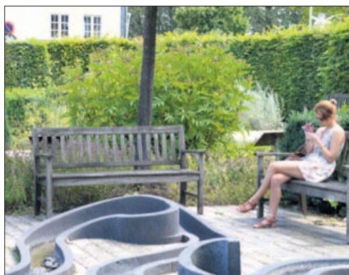
Im „Hildegarten“ am Museum am Strom, das eine Ausstellung zur heiligen Hildegard zeigt.