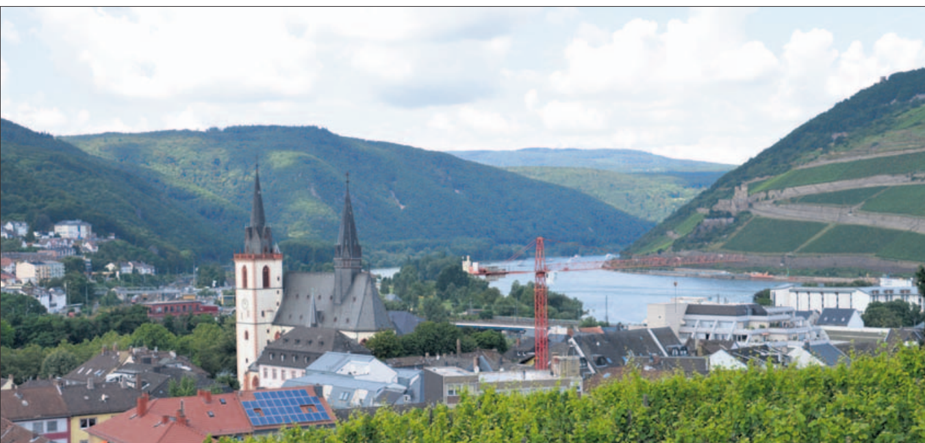
Basilika an zwei Flüssen: an Nahe und Rhein. Der Rhein trennt die Bistümer Mainz und Limburg, die Nahe die Bistümer Mainz und Trier.