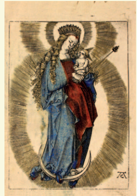
Madonna (Martinusbibliothek) KA200