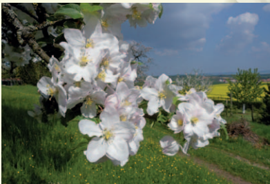
Blütenaufbruch – KA203