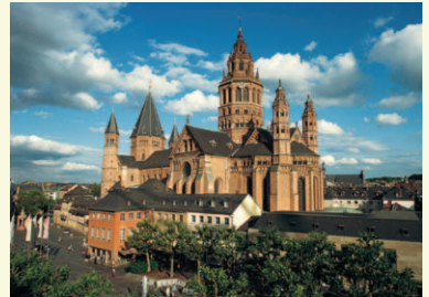
Dom St. Martin KA189A (Ansichtskarte)