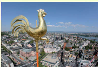
Verschneites Rheinhessen KA206 Der Domsgickel blickt über die Mainzer Innenstadt KA196