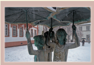
Mädchenbrunnen vor der Maria Ward-Schule KA202