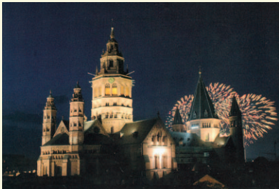
Dom mit Feuerwerk – KA100