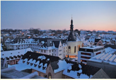
Blick über die Mainzer Altstadt zur Augustinerkirche KA195