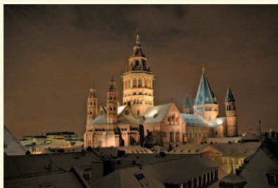
Winternacht mit Mainzer Dom – KA199

Doppelkarte mit Umschlag, 11,5 cm x 16,5 cm, 1,00 € Ansichtskarte 0,50 €