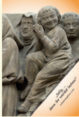
Gruppe der Seligen vom Westlettner des Mainzer Doms (Dommuseum) – KA190