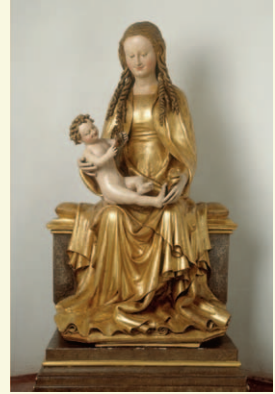
Maria mit spielendem Jesuskind, um 1420 (Augustinerkirche) KA192