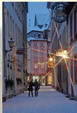
Mainzer Gredenstraße KA205