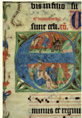
Anbetung der hl. drei Könige (Dommuseum) KA191