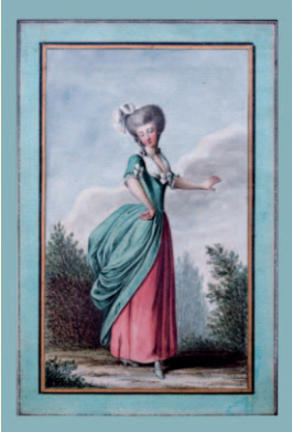
Dame aus den Physiognomischen Studien Lavaters – KA201

Zur Kabinettausstellung Martinusbibliothek Mainz 15.11.2013–21.02.2014