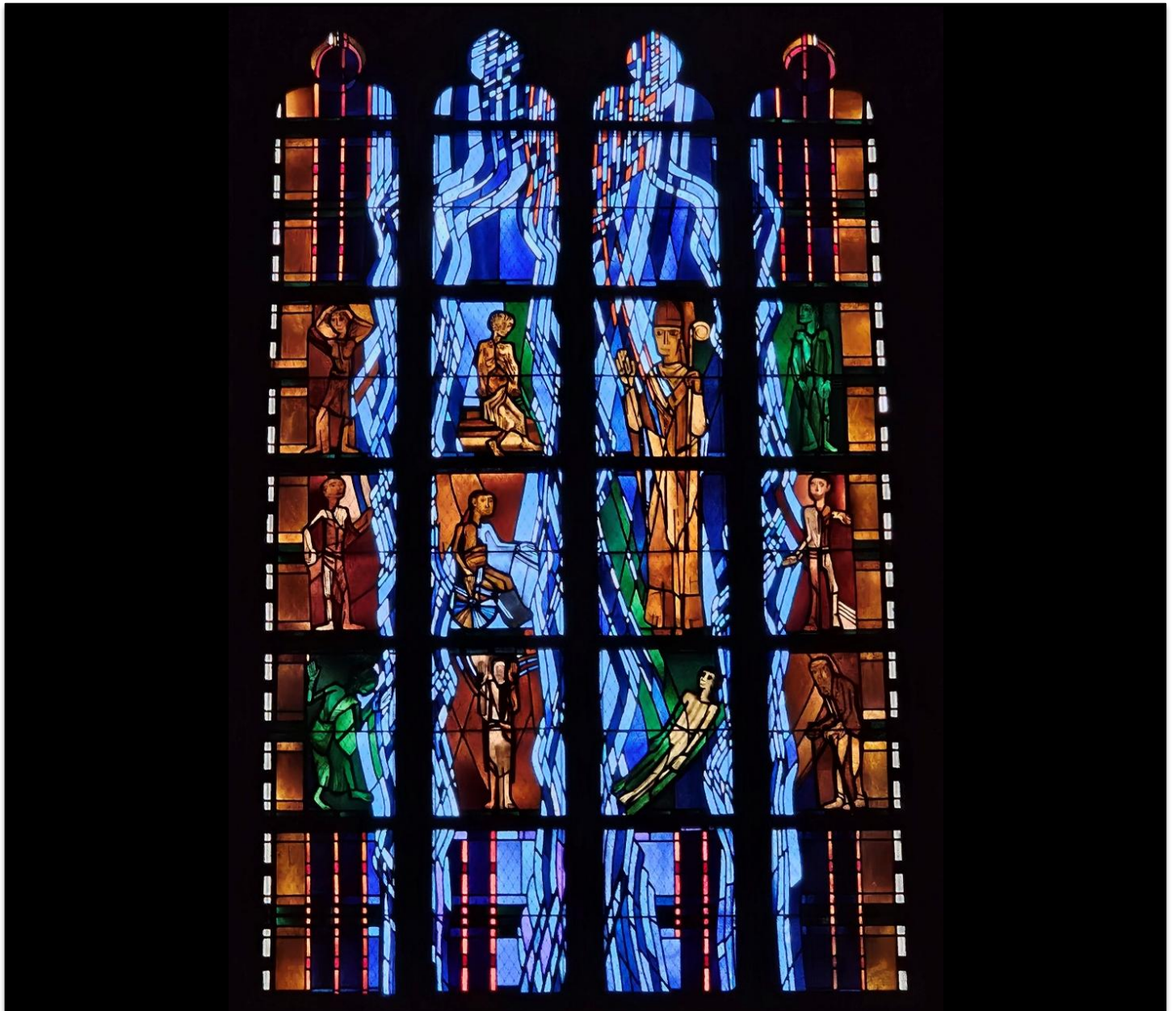
Valentinusfenster der Liebfrauenkirche