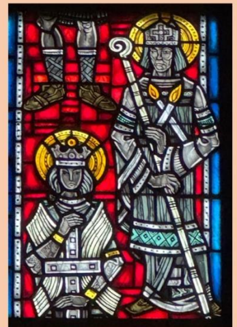
Nothelferfenster Wormser Dom

(Der Blasiussegen kann darüber hinaus empfangen werden am folgenden Samstag nach der Vorabendmesse in Leiselheim und am Sonntag nach den jeweiligen Gottesdiensten im Dom, in der Liebfrauenkirche und in der St. Martinskirche)