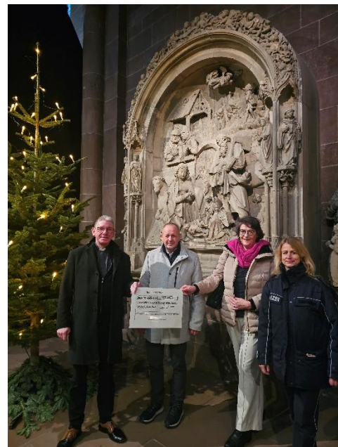
Spendenübergabe vor dem Weihnachtsrelief