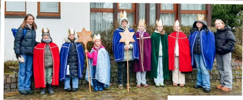
Erscheinung des Herrn