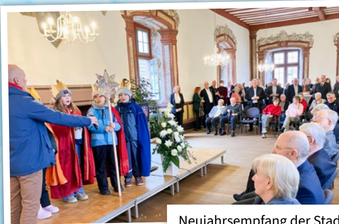
Neujahrsempfang der Stadt