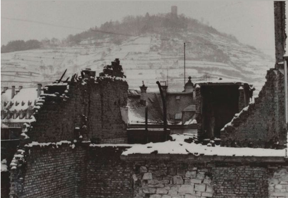
Das Bild zeigt die teilweise Zerstörung Heppenheims durch die Einnahme der Stadt. Hier "In der Krone".

VERANSTALTUNGSORT: EV. CHRISTUSKIRCHE HEPPENHEIM