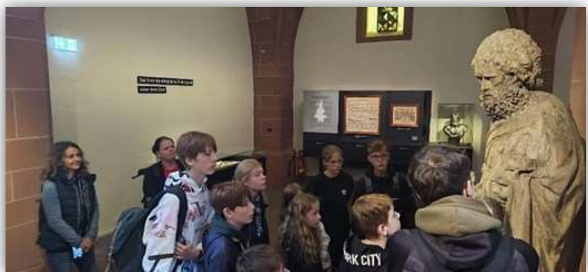
Besuch im Frankfurter Dom