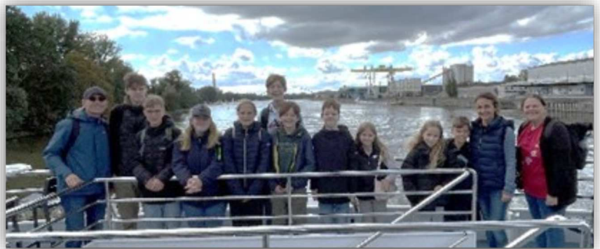
Schifffahrt auf dem Main in Frankfurt