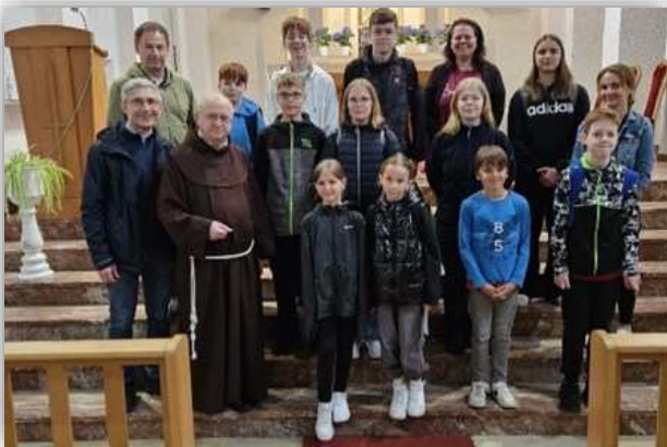
Besuch des Klosters und der Bowlingbahn

Vielen herzlichen Dank an den Verein Kinderhilfe Midalam Indien e.V., der nach seiner Auflösung durch eine großzügige Spende die Messdienerkasse aufgefüllt hat. Von dieser Spende wurden zwei tolle Ausflüge mit unserer Messdienergruppe unternommen. Im Juni besuchte die Gruppe das Franziskaner-Kloster und im Anschluss die Bowlingbahn in Bensheim. Im September war das Ziel dann Frankfurt mit einem Besuch im Dom und einer Schifffahrt auf dem Main.