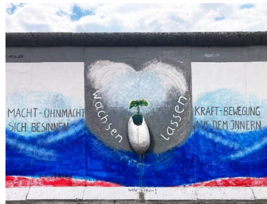
www.galerie-ros.de Teil der East Side Gallery/Berlin

Was ist #zu_frieden? Die Aktion #zu_frieden lädt Menschen dazu ein, Fotos, Geschichten, Gedanken und Erlebnisse zu posten, die inneren und äußeren Frieden widerspiegeln. Der Aufruf richtet sich an alle: Privatpersonen, berufliche Netzwerke, öffentliche Einrichtungen, Kirchen und Organisationen. Denn in einer Zeit, in der viele Menschen sich nach Frieden und Gemeinschaft sehnen, kann jeder von uns mit seinen persönlichen Erfahrungen und Geschichten einen Beitrag leisten.